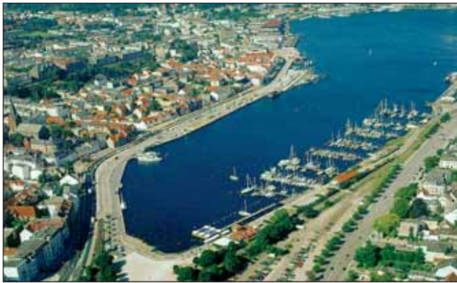
im-jaich stadthafen flensburg

Die Flensburger Förde ist 40 bis 50 Kilometer lang und hat von allen Förden und fördeartigen Fjorden der Kimbrischen Halbinsel die größte Wasserfläche. Sie bildet als langer Seitenarm der Ostsee deren westlichsten Punkt. Sie ist ein sehr schönes Segelrevier, und Segler aus vielen Ländern besuchen sie jedes Jahr. Die Flensburg-Fjord-Regatta wird alljährlich ausgetragen. Am innersten Ende liegt Flensburg, am östlichen Ufer der Innenförde das Seebad Glücksburg mit seinem berühmten Wasserschloss. Die Halbinsel Holnis ist die markanteste Landzunge der Förde und ist (nach List auf Sylt) Deutschlands nördlichster Punkt.