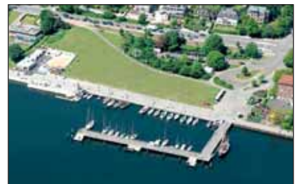
Sporthafen Reventloubrücke Tel.: (0431) 26 04 84 - 26