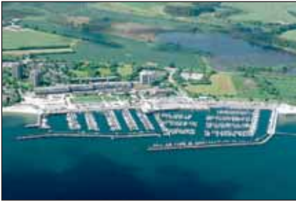
Olympiahafen Schilksee Tel.: (0431) 26 04 84 - 21/22