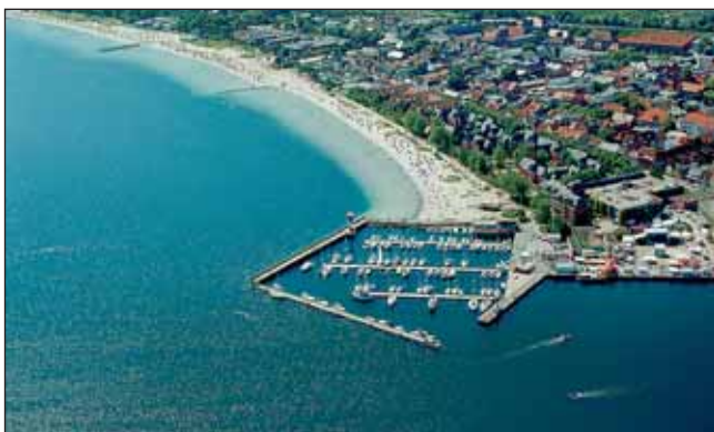
im-jaich stadthafen eckernförde

i Eckernförde Touristik & Marketing GmbH Am Exer 1 (Stadthalle), 24340 Eckernförde Tel. 04351 - 717 90, www.ostseebad-eckernfoerde.de