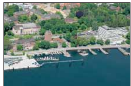
Sporthafen Seeburg Tel.: (0431) 26 04 84 - 26