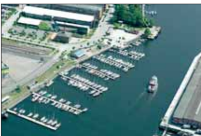
Sporthafen Dietrichsdorf Tel.: (0431) 26 04 84 - 28