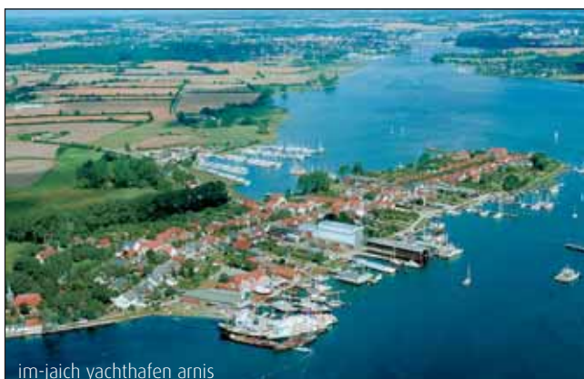
im-jaich yachthafen arnis

Seit langem zählt die Region um den Ostseefjord Schlei im Norden zu den Zentren der Gartenkunst. Dieses Renommee