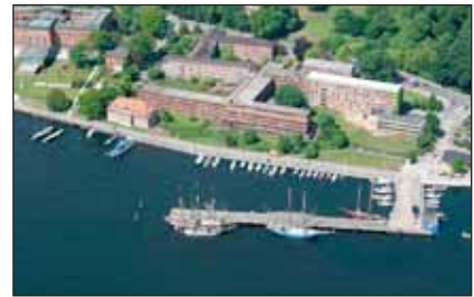
Sporthafen Blücherbrücke Tel.: (0431) 26 04 84 - 26