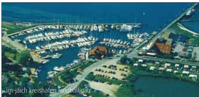
im-jäch kreishafen langballigau