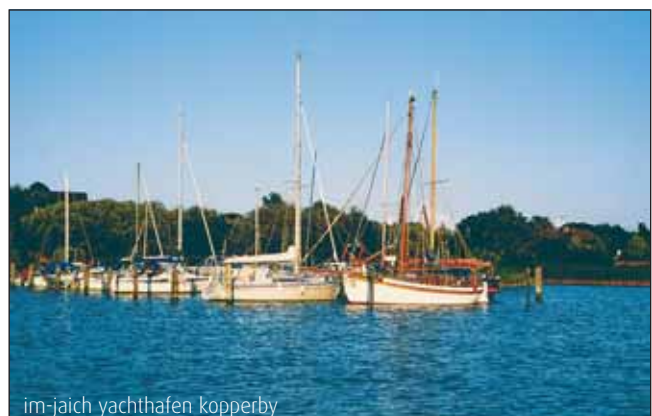
im-jaich yachthafen kopperby

verdankt sie vor allem dem Neuwerk-Garten hinter Schloss Gottorf – im 17. Jahrhundert der erste Barockgarten nördlich der Alpen. Seit August 2007 sind die liebevoll rekonstruierten und historisch bepflanzten Terrassen des Fürstengartens, in dem sich Elemente italienischer Renaissancegärten mit denen der barocken Gartenkunst vereinen, wieder zugänglich. Und im Zentrum des Gartenjuwels lädt das Globushaus mit dem rekonstruierten Gottorfer Globus dazu ein, die Welt und das Weltall aus der Sicht des 17. Jahrhunderts zu betrachten. Eine ganz andere, aber nicht minder reizvolle Gartenwelt ist in Laufweite der Gottorfer Schlossinsel auf dem Schleswiger Hesterberg zu entdecken. Hinter dem Volkskundemuseum zeigt ein liebevoll angelegter Schaugarten die bürgerliche Gartenkultur des frühen 20. Jahrhunderts. Eine traumhafte Oase der Ruhe – und Heimat zahlreicher selten gewordener Pflanzen.