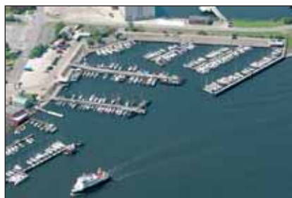
Sporthafen Wellingdorf Tel.: (0431) 26 04 84 - 28