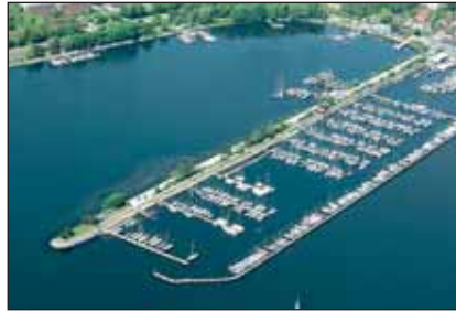
Sporthafen Stickenhörn Tel.: (0431) 26 04 84 - 24